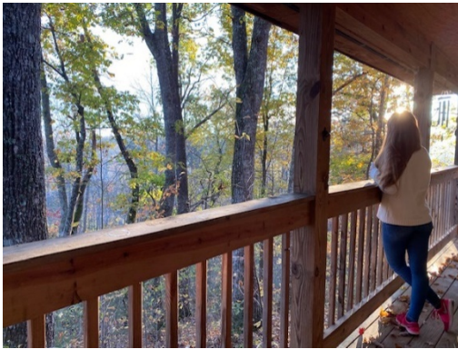
Great Smokey Mountains ↑ Piedmont Park in Atlanta ↓