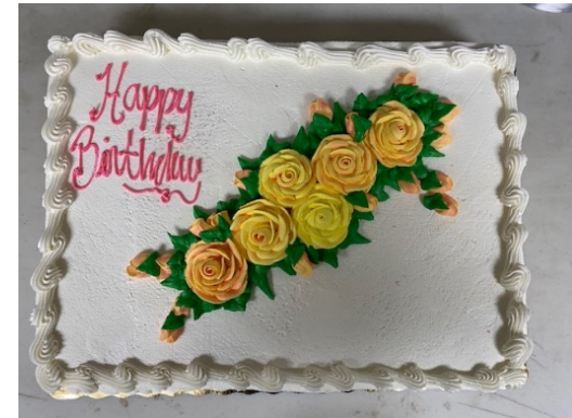
Unsere „monthly birthday celebration“