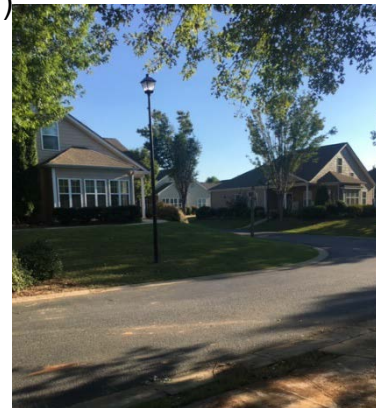
↑ Unser „Intern House“