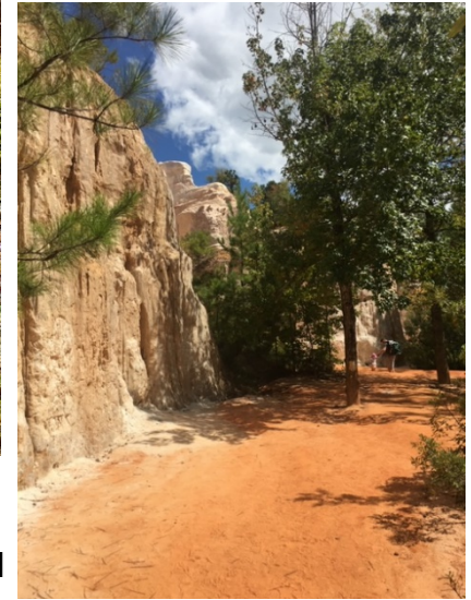
→ Little Grand Canyon in Georgia