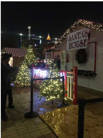
Grenzebach | Newnan, USA

Des Weiteren konnte ich eine Menge unterschiedlicher Orte während meiner Zeit in den USA bereisen (u. a. New York, Florida, Las Vegas, National Parks, Savannah, Charleston...)