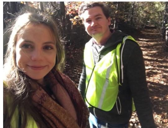
„Street Clean Up“ im Rahmen des internen Wellnessprogramms