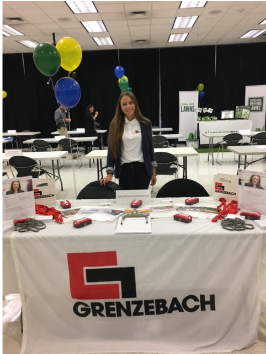
Besuch einer „job fair“