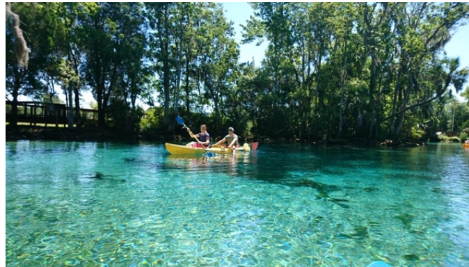
↑ Crystal River in Florida (perfekt zum Kayak fahren!!)