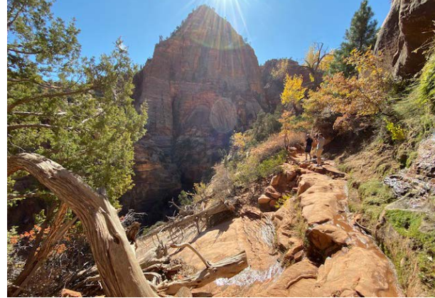
↑ Zion National Park in Utah