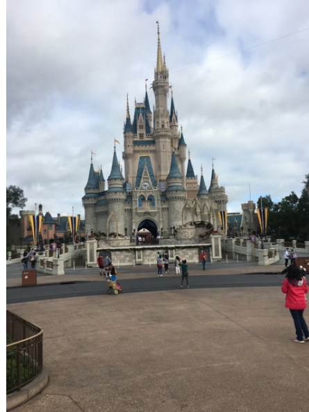
Disney World in Orlando ↑